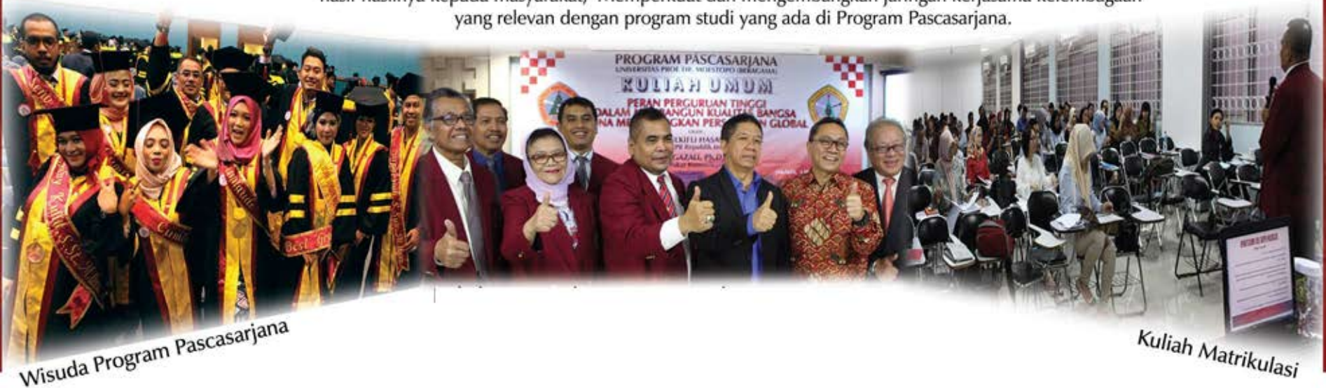
Wisuda Program Pascasarjana

MISI Menyelenggarakan pendidikan pascasarjana sesuai dengan perkembangan ilmu pengetahuan dan teknologi serta kebutuhan pengguna lulusan, Mewujudkan sumber daya manusia yang berkualitas, unggul, profesional, dan berintegritas di Program Pascasarjana, Meningkatkan kualitas pendidikan dan pelayanan kepada mahasiswa Program Pascasarjana, Mengembangkan kegiatan penelitian dan pengabdian kepada masyarakat yang relevan dengan program studi yang ada di Program Pascasarjana serta menyebarkan hasil-hasilnya kepada masyarakat, Memperkuat dan mengembangkan jaringan kerjasama kelembagaan yang relevan dengan program studi yang ada di Program Pascasarjana.