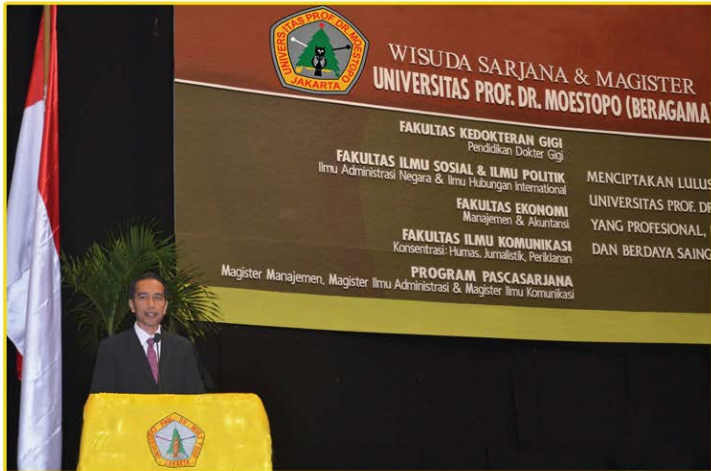
Orasi Ilmiah Bapak Ir. H. Joko Widodo dalam Wisuda Sarjana dan Magister Universitas Prof. Dr. Moestopo (Beragama)