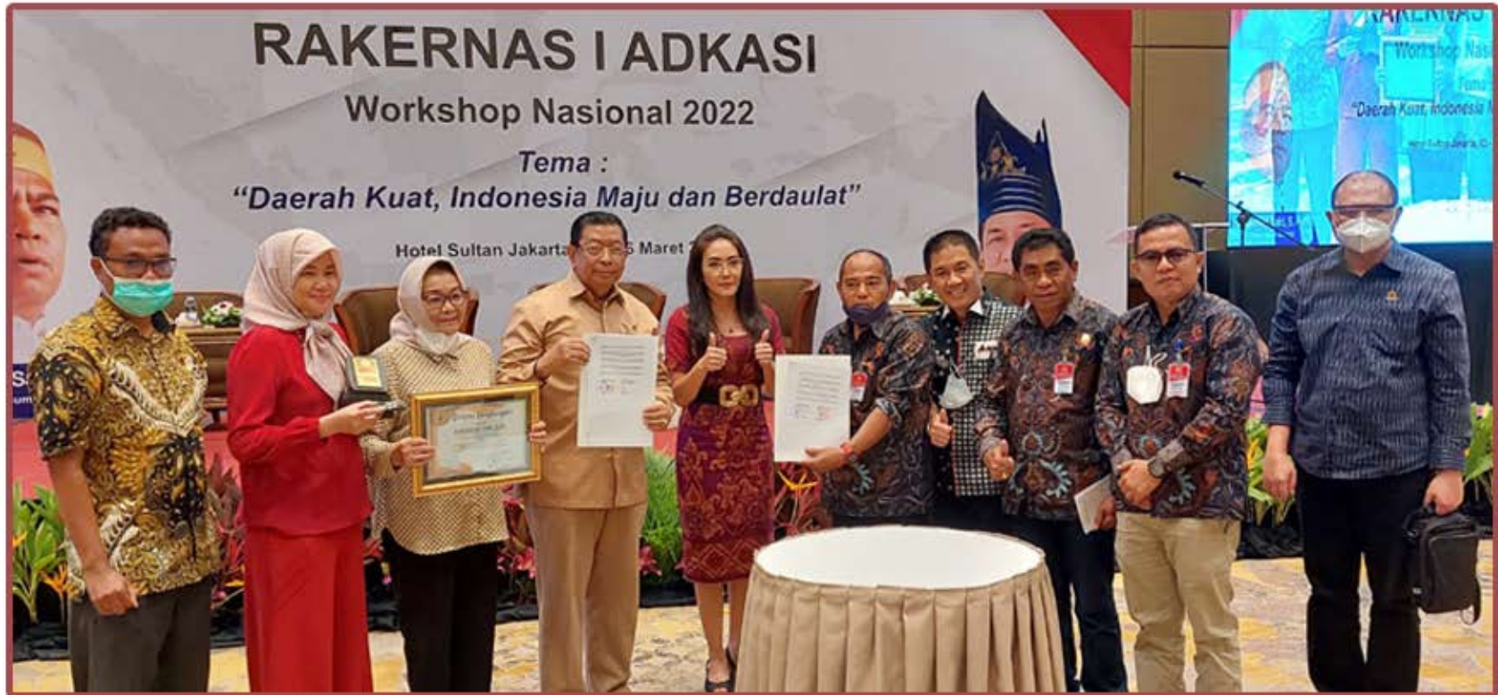
Penandatanganan Nota Kesepakatan Program Pascasarjana UPDM(B) dengan Asosiasi Dewan Perwakilan Rakyat Daerah Kabupaten Seluruh Indonesia (ADKASI)