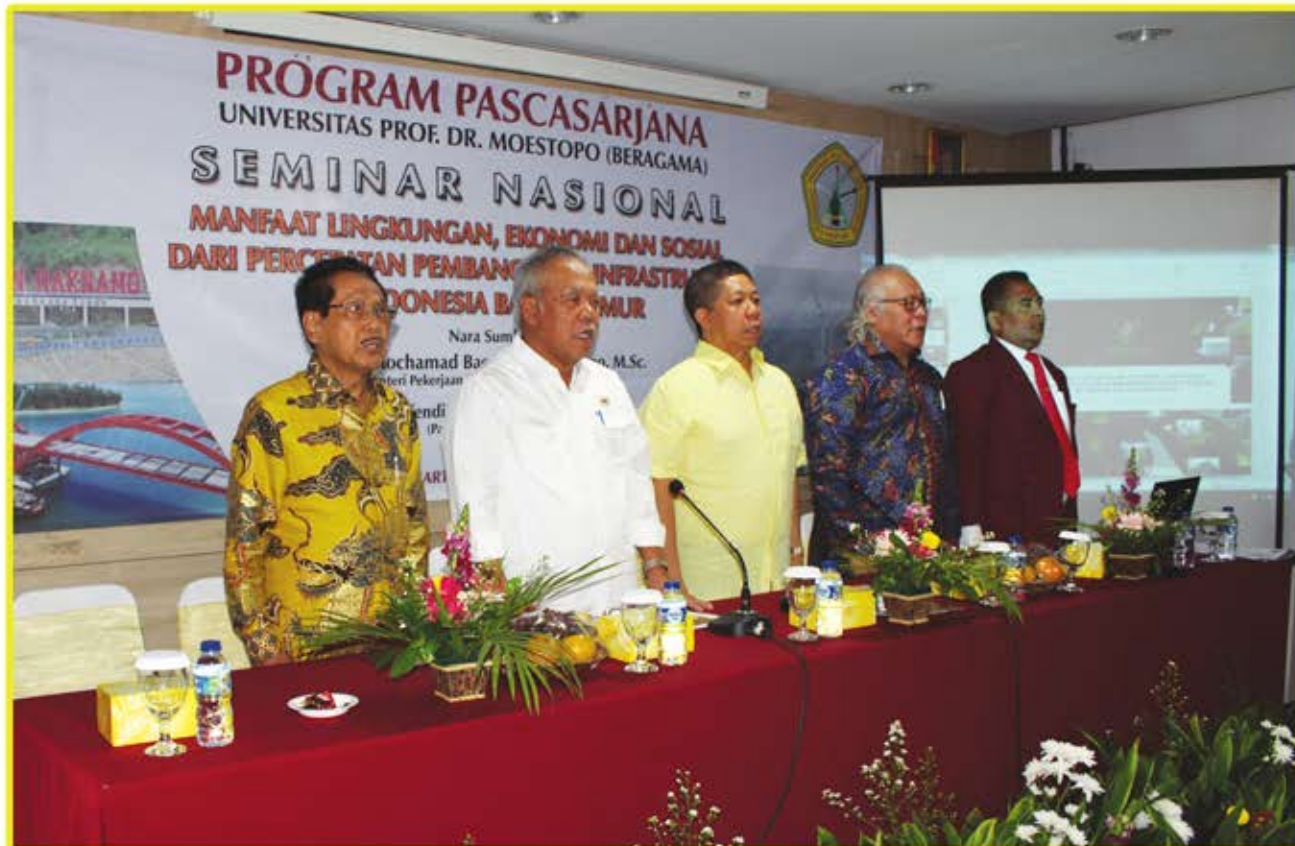
Seminar Nasional dengan Narasumber Menteri Pekerjaan Umum dan Perumahan Rakyat Dr. Ir. Mochamad Basuki Hadimuljono, M.Sc.