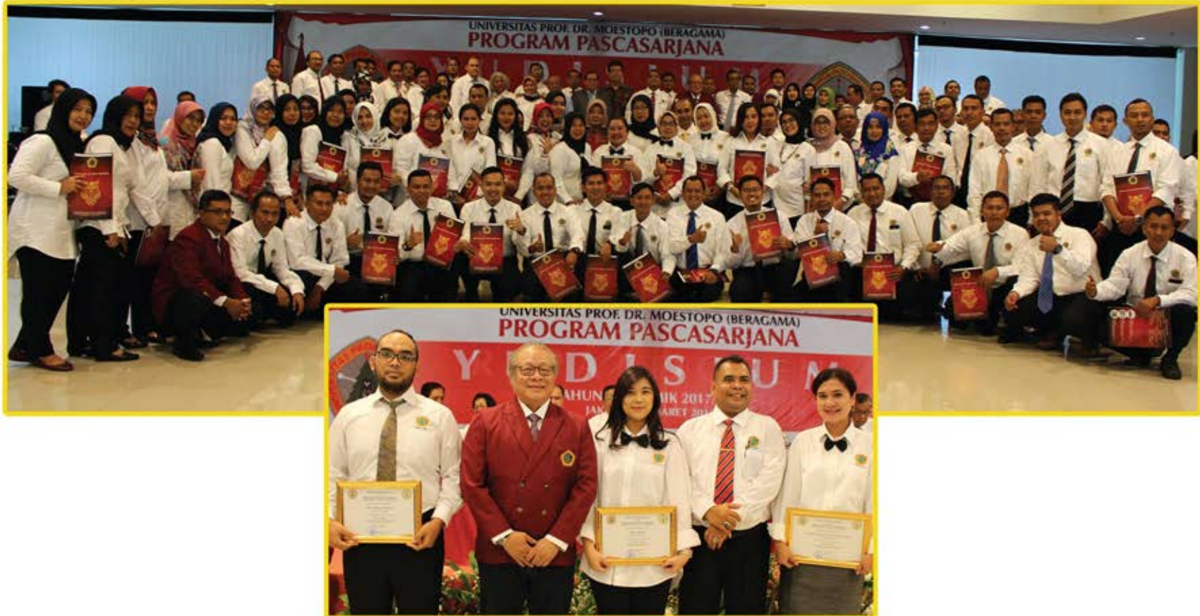
Lulusan Terbaik Program Pascasarjana