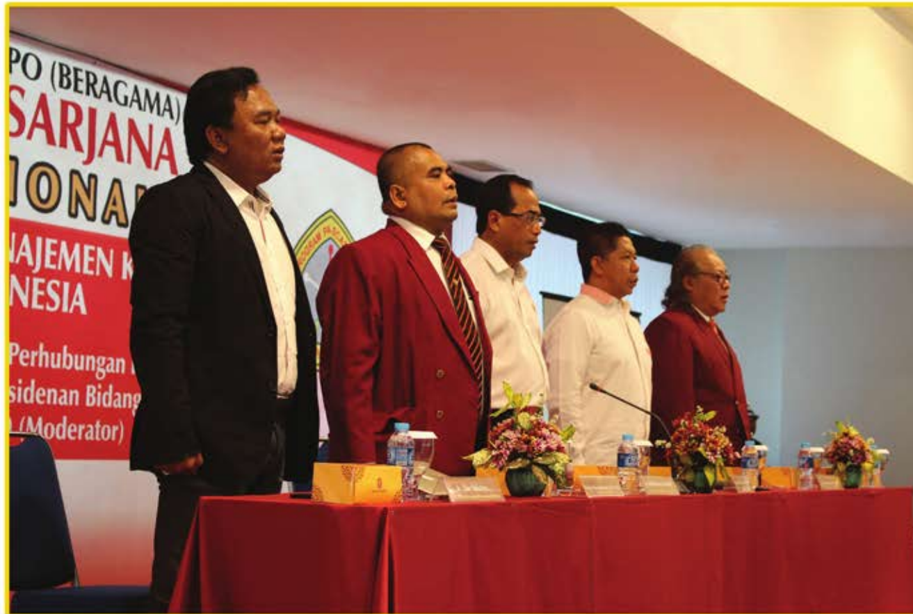
Seminar Nasional dengan Narasumber Menteri Perhubungan Ir. Budi Karya Sumadi