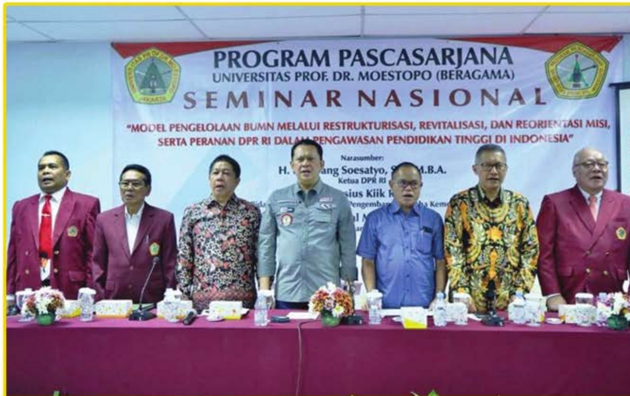
Seminar Nasional dengan Narasumber Ketua MPR RI H. Bambang Soesatyo, S.E., M.B.A.