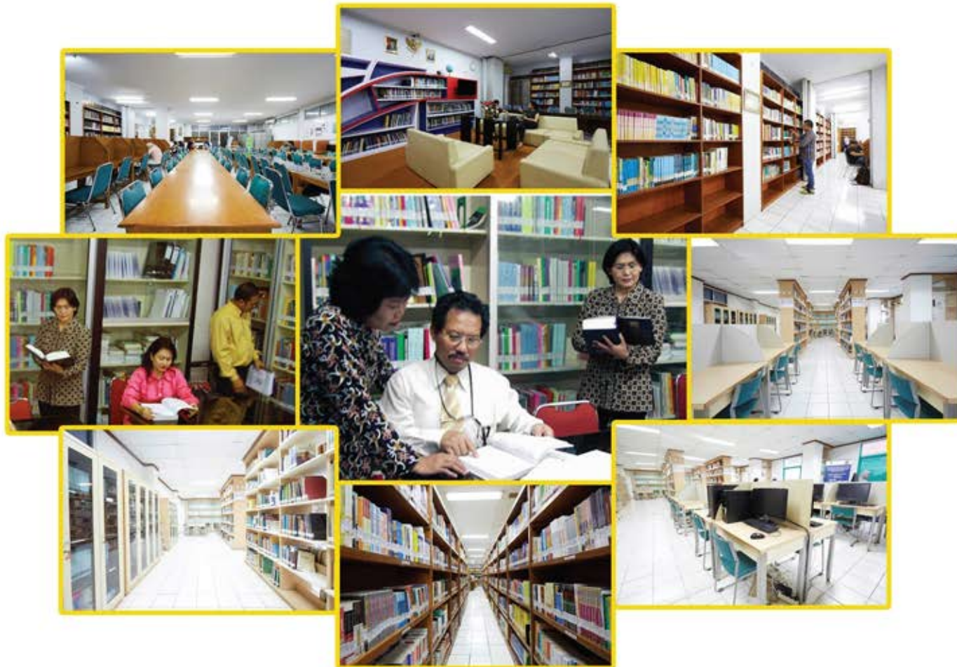
Perpustakaan Universitas Prof. Dr. Moestopo (Beragama)